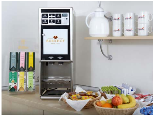
Kaffee-Teestation im Klinikum Landshut